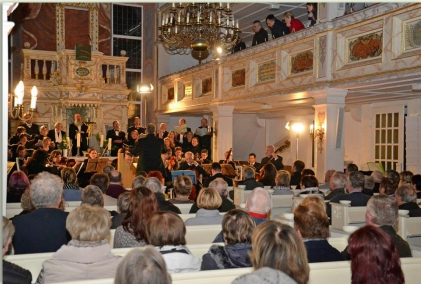
Weihnachtsoratorium in Finsterbergen